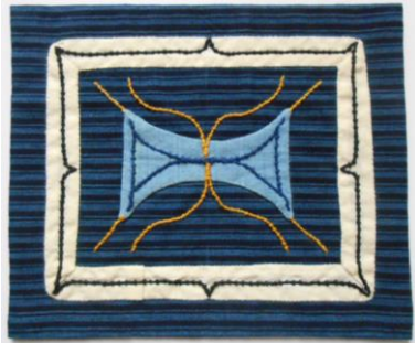
「ロシア博物館所蔵 北海道の女性半手袋」文様 (約 縦 15cm×横 18cm)