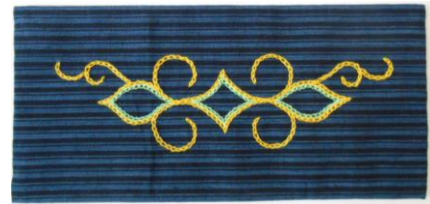
チチリ文様 (約 縦 11cm×横 23cm)