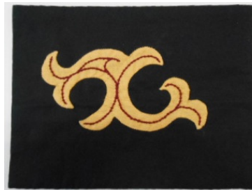
カラフト カバラミブ文様壁掛 (約 縦16cm×横21cm)