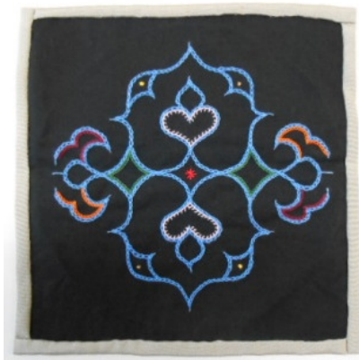
カラフト チヂリ文様壁掛 (約 23cm×23cm)