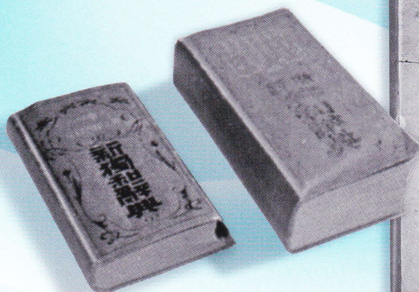
啄木愛用の英和辞典、独和辞典